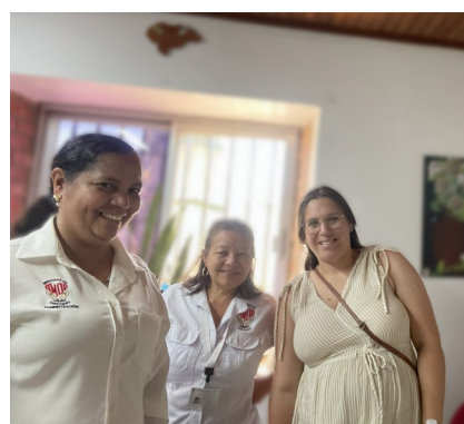
Regelbunden kontakt med administrationen är viktig för uppföljning och för att säkerställa att våra pengar kommer fram.

Samtidigt bärs arbetet upp av en gemensam struktur, där erfarenheter delas och riktningen är gemensam. Administrationen sker gemensamt med samfundet. Det är en viktig del i att skapa transparens. Stabilitet skapas som gör att arbetet kan växa utan att tappa kvalitet eller fokus.