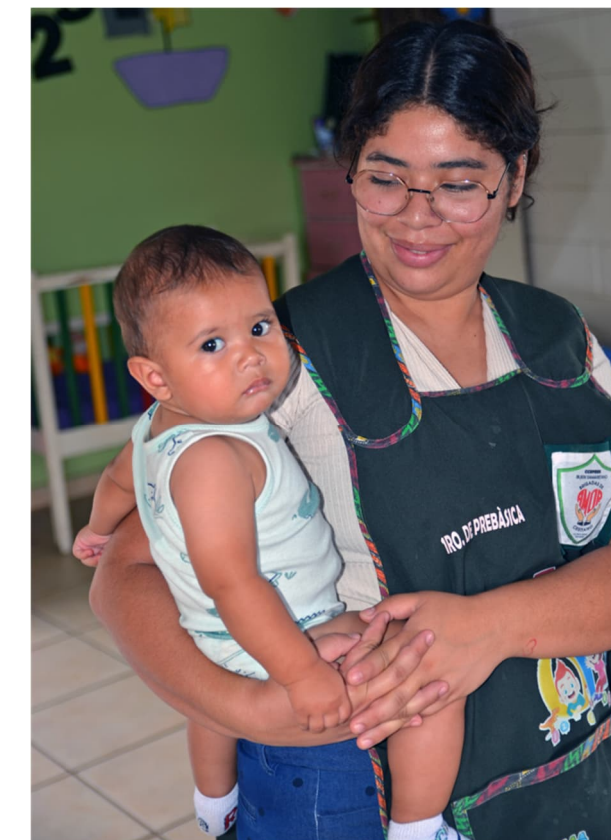
Lizzy har tidigare vuxit upp på Renacer tillsammans med sina syskon. Idag arbetar hon på småbarnsavdelningen på daghemmet i Suyapa.

Text: Louice Almqvist