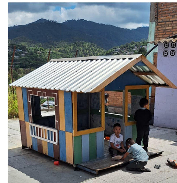
Lekstugan som några svenskar byggde då de var på besök används fortfarande flitigt. Ett välbehövt skydd när det leks under solens hetta.

när vi kliver ut på Suyapas gator igen. Tänk att det var här det hela började för snart 50 år sedan.