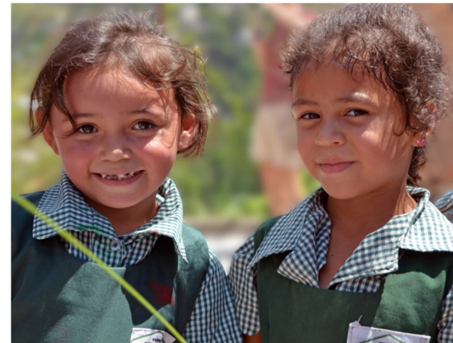
Två elever på förskolan som stannar för att prata med oss under rasten, efter det var det gungorna som gällde.

sitter inne på hennes kontor och hör henne prata med pappan till en elev som varit sjuk. De har varit på en klinik och fått medicin och vi får uppfattningen av att medicinen inte har varit lätt att köpa, förmodligen är den ganska dyr men pappan har