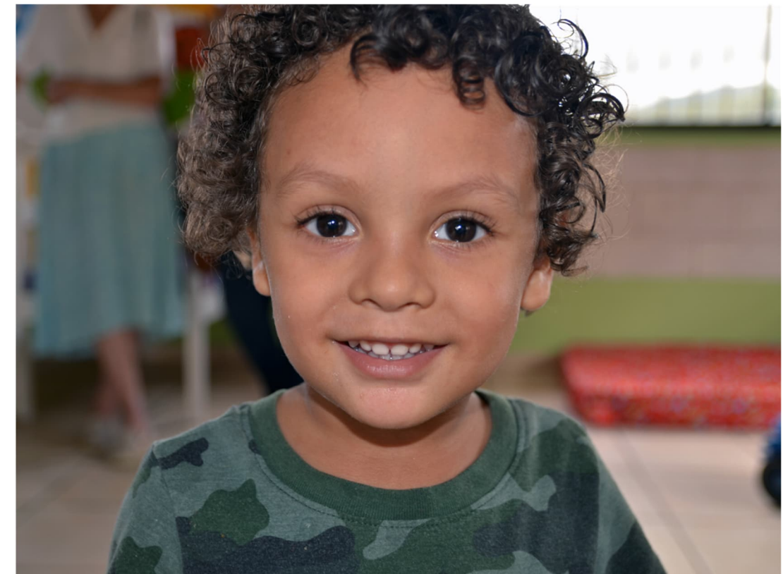
En glad och social pojke som går på daghemmet i Suyapa.