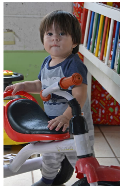
På småbarnsavdelningen är det full fart framåt som gäller.