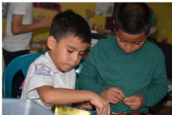
Två elever i förskoleklass koncentrerar sig på att sätta ihop ett pussel med rätt bokstav på rätt plats.